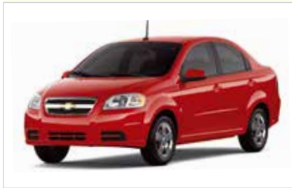
E4 (2-4-türig Economy)