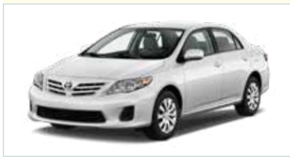
I4 (2-4-türig Intermediate)