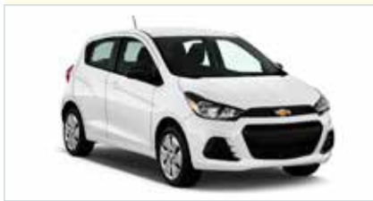
EC (2-türig Economy)