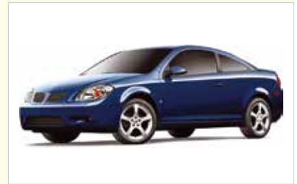
I4 (4-türig Midsize)