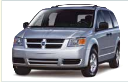
LX (Mini-Van 7 Personen)