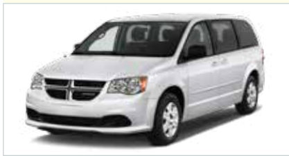
LX (Mini-Van 7 Personen)