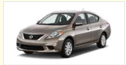
C4 (4-türig Compact)