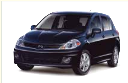
C4 (4-türig Compact)