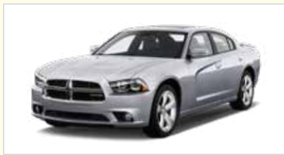
S4 (4-türig Full Size)