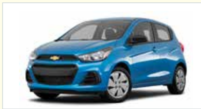
E4 (2-4-türig Economy)