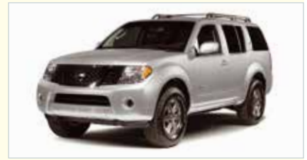
LW (Standard SUV)