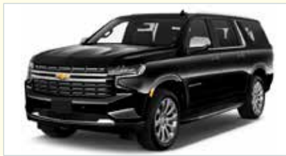
PF (Premium SUV)