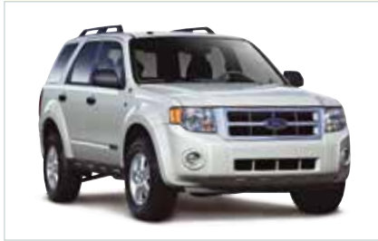
IW (Midsize SUV)