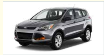
IW (Midsize SUV)