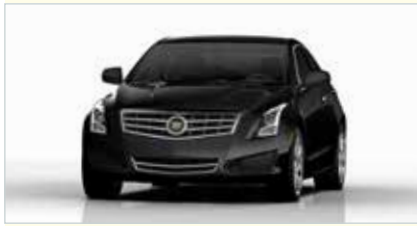
L4 (4-türig Luxus)