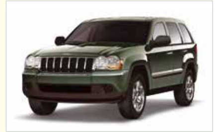
LW (Standard SUV)